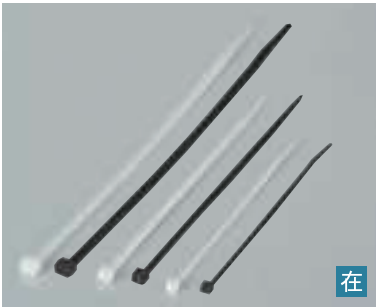
■色：白・黒 UL規格認定品

ABシリーズ型番の数字は長さの目安を示しています。屋内用は乳白色、屋外用は黒色の製品をご使用ください。